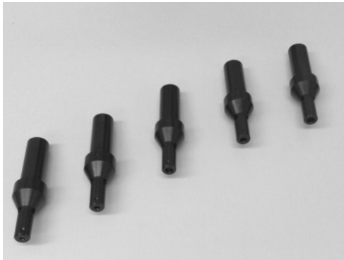
Abbildung: Stangengreifer 3,0mm – 7,0mm (STG.3 – STG.7)

Es werden keine Backen in den Stangengreifer eingesetzt.