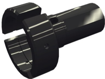
Abbildung: Stangengreifer - Zylindrischer Schaft (für Material \varnothing 8 - 90 mm)

Backensätze finden sie auf Seite:6 - 7 (2.1.1/ 2.1.2)