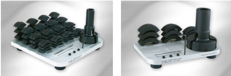
Abbildung: Stangengreifer mit Backenset -hier Set: B.032 und C.040