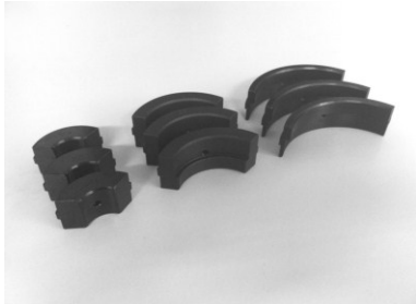
Abbildung: Beispiel für Backensätze. Hier für den Stangengreifer(STG)B/C/D

Zum Greifen von Material-Ø 8,0 – 90,0 mm benötigen sie Greiferbackensätze die sie in den Stangengreifer einsetzen